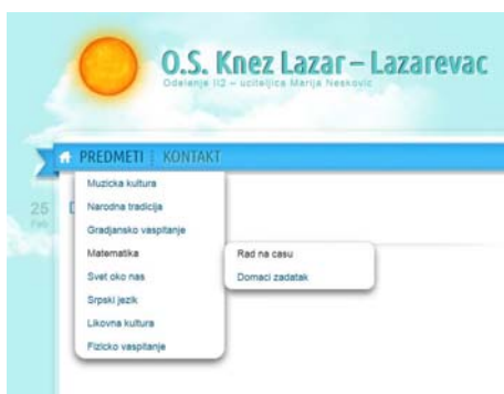
Slika 1: Meni

Da bi se roditeljima omogućilo jednostavno pronalaženje potrebnih informacija, web stranica koja prezentuje nastavni proces mora biti jednostavna i mora imati dobru koncepciju. Ova jednostavnost se postiže kreiranjem "ne natrpanih menija", koji moraju da budu pregledni i daju lak izbor između izbora informacija o radu na času i predviđenog domaćeg zadatka za svaki nastavni predmet posebno (slika 1).